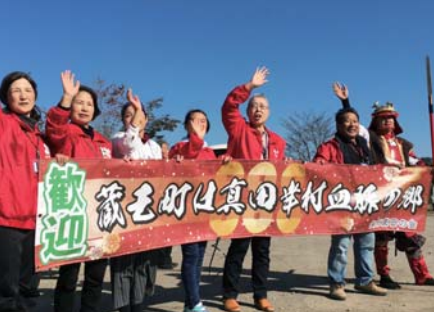
みなさまのお越しをお待ちしています！