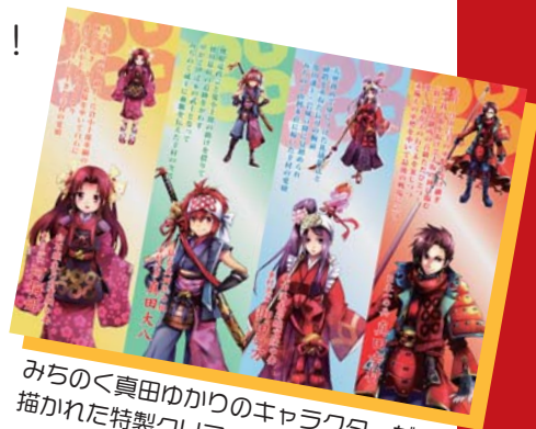
みちのく真田ゆかりのキャラクターが描かれた特製クリアファイルプレゼント!