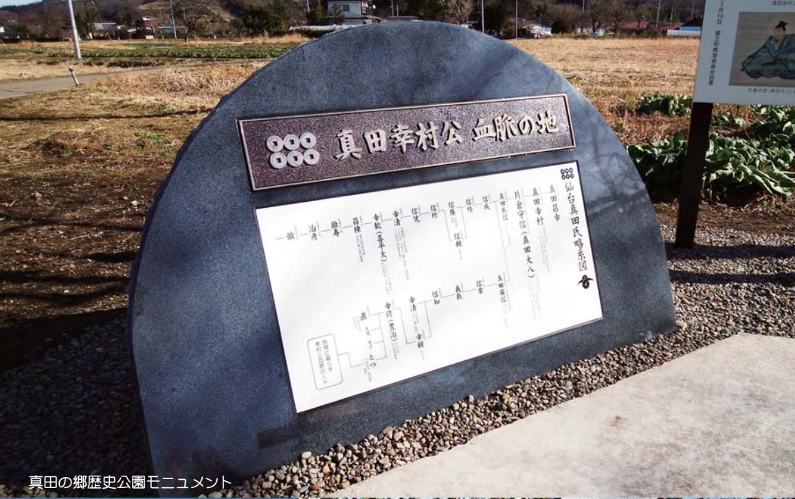
真田の郷歴史公園モニュメント