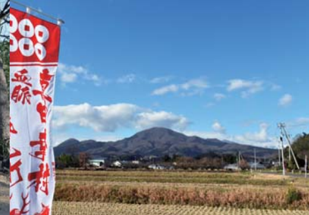
真田の郷から眺める青麻山の風景