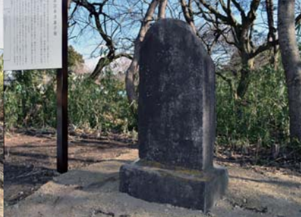
仙台真田氏本家・幸清の筆子塚