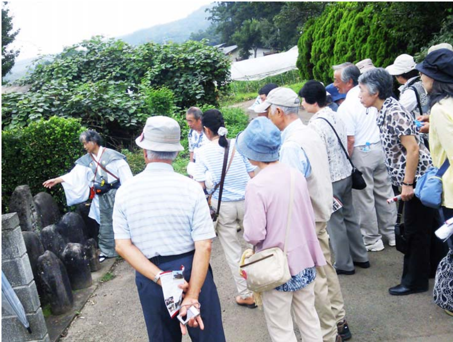
ボランティアガイドによる真田史跡ご案内