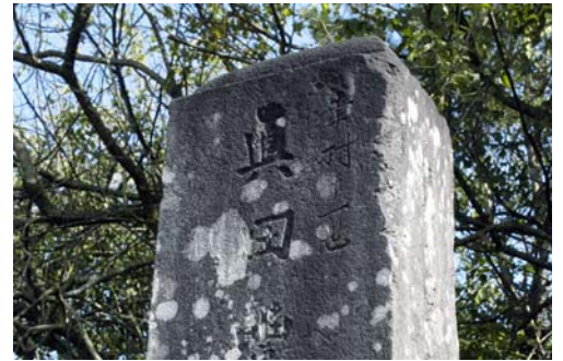
『幸村十一世』と刻まれた仙台真田氏の墓碑