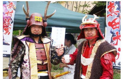
『仙台真田武将隊一縁一』おもてなし