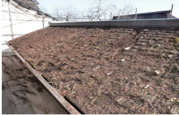
19 板蔵 屋根の破損状況