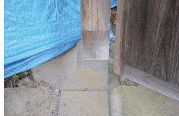
23 表門 柱位置修正

令和3年の地震により、門が背面側へ傾斜した。主柱の位置が礎石からずれており、控柱の根元の腐朽も一因として考えられた。