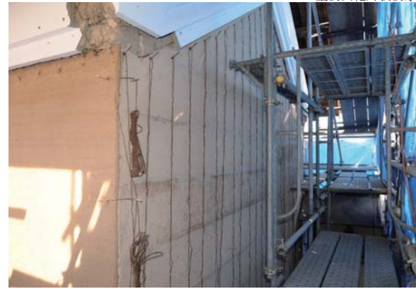
16 前蔵 斑直し

壁の破損状況を観察すると、下地の荒壁土は保存できると判断した。ただ、そのままでは弱いため土壁の強化剤を表面から塗布し、荒壁土がポロポロと剥離するのを防いだ。亀裂には、新たな荒壁土を塗り込み、斑直しの時に伏せる下げ縄を取り付けた（小舞を避けて壁に穴を開けて、小舞に縄を絡めて外側に出している）。