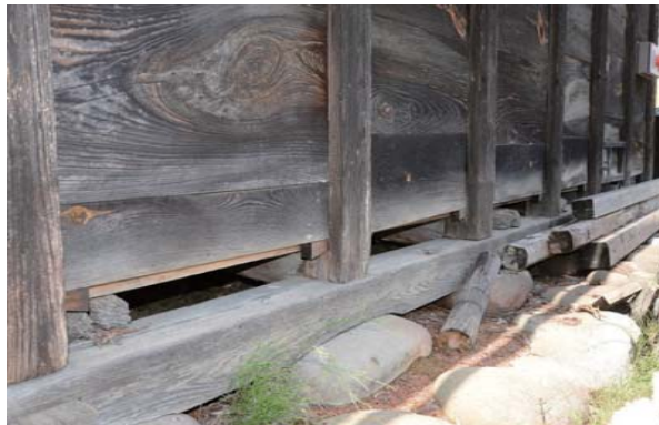
21 板蔵 地震被害の補修

一旦全ての屋根板を解体し、野地を補修して葺替えた。 前蔵と同様に屋根はクリ材のとち葺であるが、屋根の勾配（傾き）が緩いため、板の長さを48cmにして、葺き足を12cmにしている（修理前の仕様に倣った）。