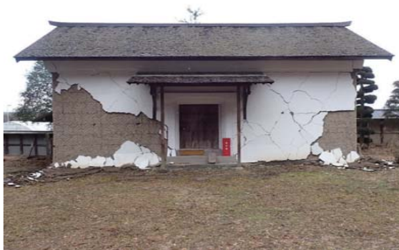
13 前蔵 地震被害