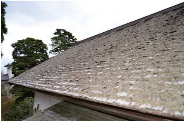
14 前蔵 屋根破損状況