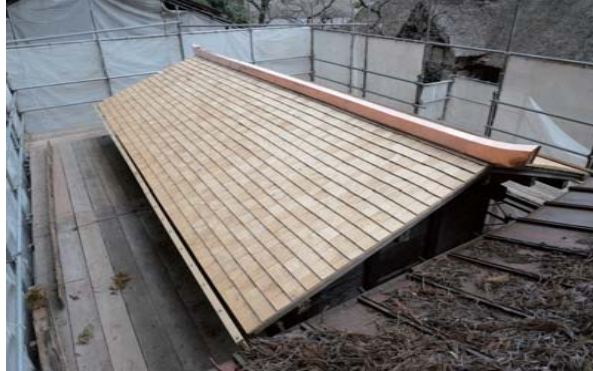
20 板蔵 屋根葺替え

一旦全ての屋根板を解体し、野地を補修して葺替えた。 前蔵と同様に屋根はクリ材のとち葺であるが、屋根の勾配（傾き）が緩いため、板の長さを48cmにして、葺き足を12cmにしている（修理前の仕様に倣った）。