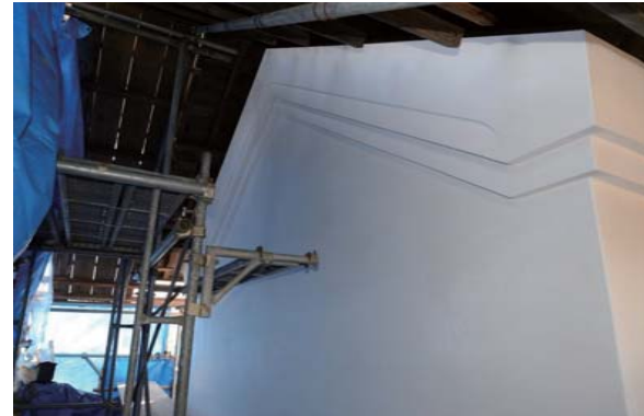
17 前蔵 漆喰塗り完了

斑直しの工程を数回繰り返した。前述の下げ縄を伏せ込んだ後、次の塗り重ね工程「付送り」では、壁上端に竹釘を打ち、そこにシュロ縄を引掛けて縦に垂れ下げた。これを塗籠めた後、次に横方向にもシュロ縄を伏せ込んだ。