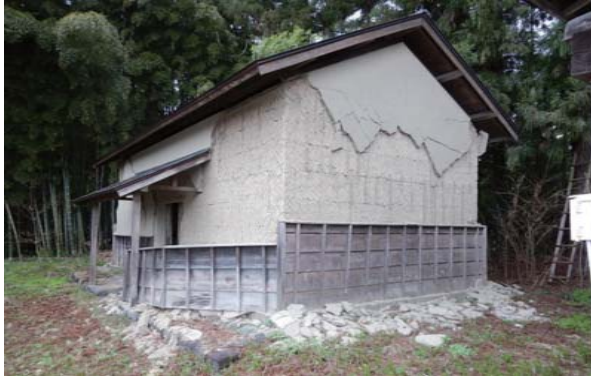
25 穀蔵 地震被害