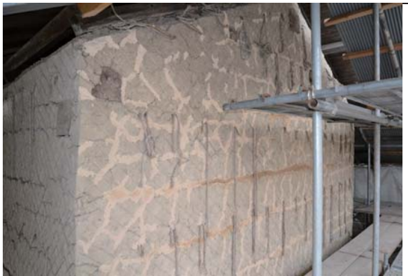
27 穀蔵 壁修理

前蔵と同様に荒壁強化剤を塗布した後、ひび割れ箇所を埋めた。その後、既存の藁縄の他に、シュロ縄も追加した。