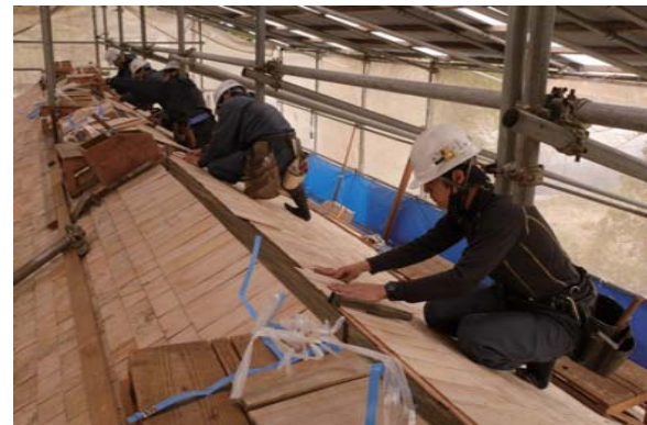
18 前蔵 屋根とち葺

壁面と屋根の境部分に付ける出っ張り部分を鉢巻と呼ぶが、この部分は保存して亀裂部の補修を行った。最終仕上げには、漆喰を薄くしたノロを掛けて仕上げた。