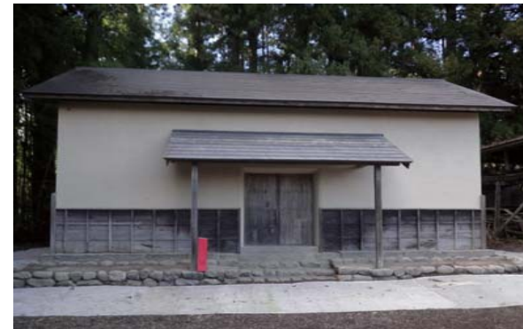
30 穀蔵 中塗り

前蔵と同様に荒壁強化剤を塗布した後、ひび割れ箇所を埋めた。その後、既存の藁縄の他に、シュロ縄も追加した。