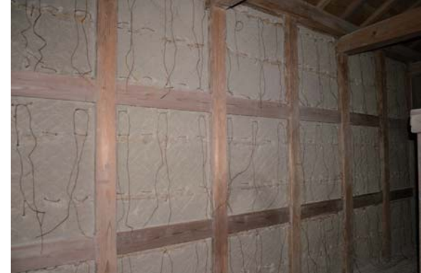
28 穀蔵 内部下げ縄

外側と同様に、内側にもシュロ縄を下げた。縄の位置は、小舞の場所を見計らって穴を開けている。