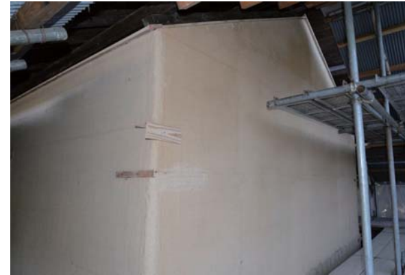
29 穀蔵 斑直し完了