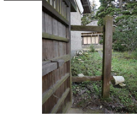
22 表門 地震被害

令和3年の地震により、門が背面側へ傾斜した。主柱の位置が礎石からずれており、控柱の根元の腐朽も一因として考えられた。