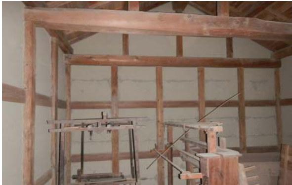
26 穀蔵 内部壁破損状況

外側と同様に、内側にもシュロ縄を下げた。縄の位置は、小舞の場所を見計らって穴を開けている。