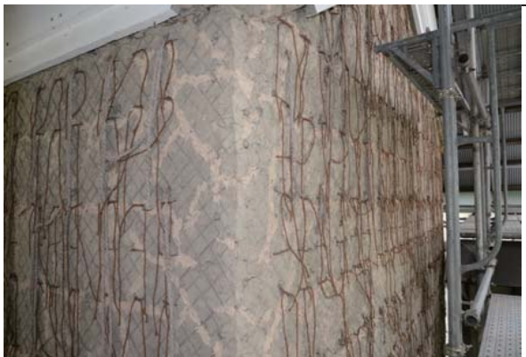
15 前蔵 壁修理

壁の破損状況を観察すると、下地の荒壁土は保存できると判断した。ただ、そのままでは弱いため土壁の強化剤を表面から塗布し、荒壁土がポロポロと剥離するのを防いだ。亀裂には、新たな荒壁土を塗り込み、斑直しの時に伏せる下げ縄を取り付けた（小舞を避けて壁に穴を開けて、小舞に縄を絡めて外側に出している）。